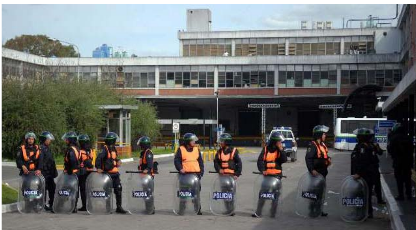
Die berüchtigte argentinische Polizei besetzte das Fabrikgelände, um die Interessen des US-Konzerns gegenüber den Arbeitern geltend zu machen.

1 CCC-PCR: Revolutionäre Kommunistische Partei (Maoisten).