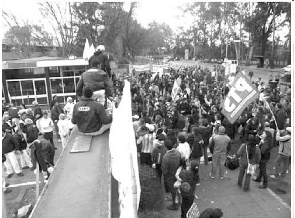
Arbeiter auf beiden Seiten des Fabriktors: Die Fabrik wurde 38 Tage lang lahmgelegt

Der Grund für die großen Auswirkungen der Aktionen der Arbeiter von