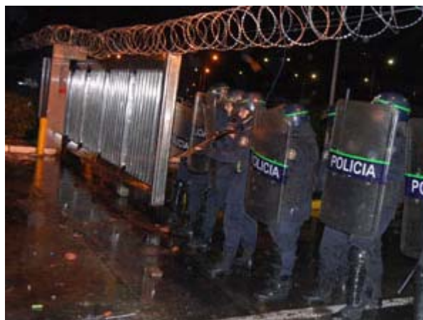
Stacheldraht und Polizei am Fabriktor gegen die Avantgarde