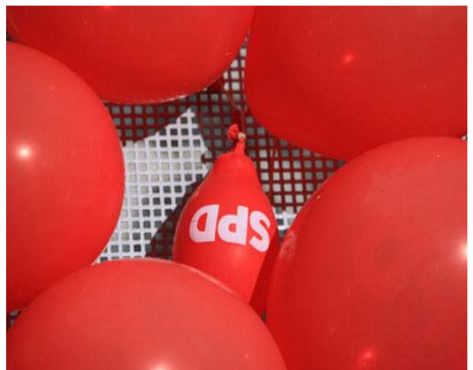
Bei der SPD ist die Luft raus

Auf der Ebene des Regimes sind in den letzten Jahren Veränderungen zu beobachten, die zu einem endgültigen Zusammenbruch des Zweiparteiensystems geführt haben. An seine Stelle ist ein parlamentarisches System getreten, das zunehmend instabil ist, wodurch die Bildung stabiler Koalitionen erschwert wird. Dies ist auf das Entstehen neuer Vermittlungsinstanzen zurückzuführen, v.a. auf DIE LINKE und andere kleineren Parteien. Somit wird die Bildung neuer Koalitionen immer schwieriger aufgrund der Notwendigkeit, Mehrheitskoalitionen mit immer mehr Parteien zu bilden, die in Abhängigkeit von den erhaltenen Stimmen ihre Forderungen mehr oder weniger geltend machen. Dies ist z.B. im Falle der FDP zu beobachten, die durch ihr gutes Wahlergebnis ermutigt wurde. Der Corriere della Sera fasste dies folgendermaßen zusammen: „Leider hat sich Deutschland italianisiert. Es hat aufgehört, ein grundsätzlich bipolares System zu sein. Statt dessen verfügt es nun über fünf Pole. Damit ist die BRD heute weniger stabil und vorhersehbar“.