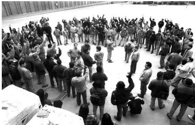
Zanon: Ein Beispiel von Arbeiterdemokratie: Die Stimmen werden gezählt