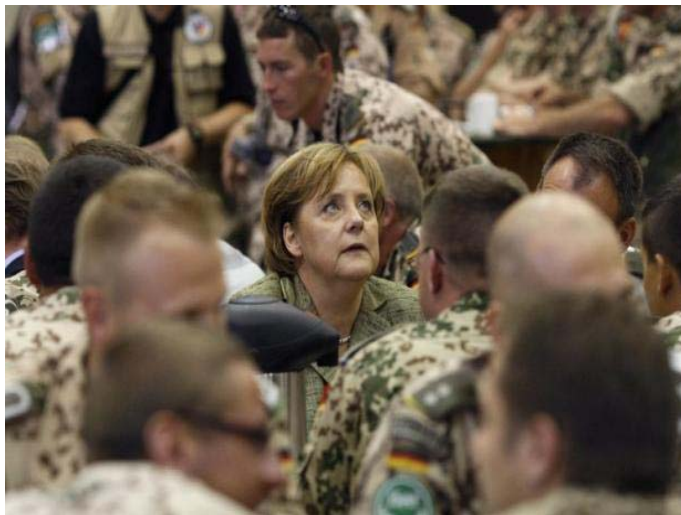
Bundeskanzlerin Angela Merkel (CDU) spricht mit deutschen ISAF-Soldaten im afghanischen Camp Marmal in Masar-i-Scharif

(förderungs-)Politik und, um den Anschein zu wahren, im Bildungssektor. Die deutsche „Entwicklungszusammenarbeit“ hat zum Ziel, einen „landesweiten Ansatz über Einflussnahme in Politikbereiche der nationalen Ebene“ zu erreichen. Dies soll mittels des Wiederaufbaus der Infrastruktur, also Trinkwasser- und Energieversorgung, und im Bereich der nachhaltigen Wirtschafts-(förderungs-)Politik geschehen; durch die Beratung der afghanischen Regierung bei der Gestaltung einer investitions- und unternehmerfreundlichen Wirtschaftsverfassung; der Einrichtung der Investitionsagentur AISA, die die „Erleichterung der Investitionsprozesse und die Förderung von Investitionen in Afghanistan zum Ziel hat.“