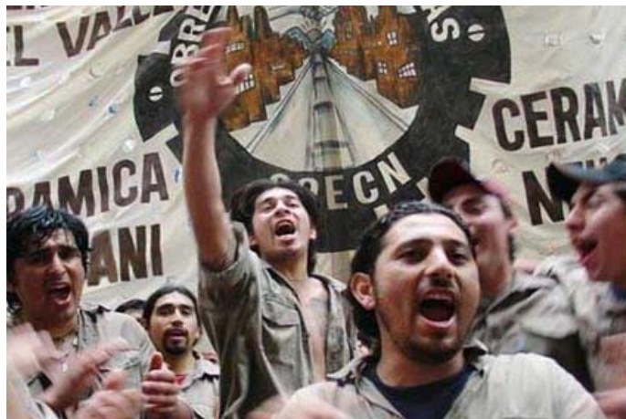
Die Arbeiter von Zanon feiern ihren Etappensieg

Da sich die ArbeiterInnen bewusst waren, dass die erreichte Enteignung noch nicht das Ende ihres Kampfes sein wird und dass der Enteignungsvertrag Artikel für Artikel untersucht werden müsste, da ihnen Fallen gestellt werden könnten (wie die des „sozialen Friedens“ oder der Zahlung von Verlusten), stimmten sie für eine erneute Mobilisierung am nächsten Tag vor dem Rathaus. Dieser Tag ist das Ende eines wichtigen Stücks Geschichte und gleichzeitig der Beginn eines neuen, nicht weniger schwierigen und kämpferischen Weges. Denn, wie Raul Godoy immer wieder wiederholt: