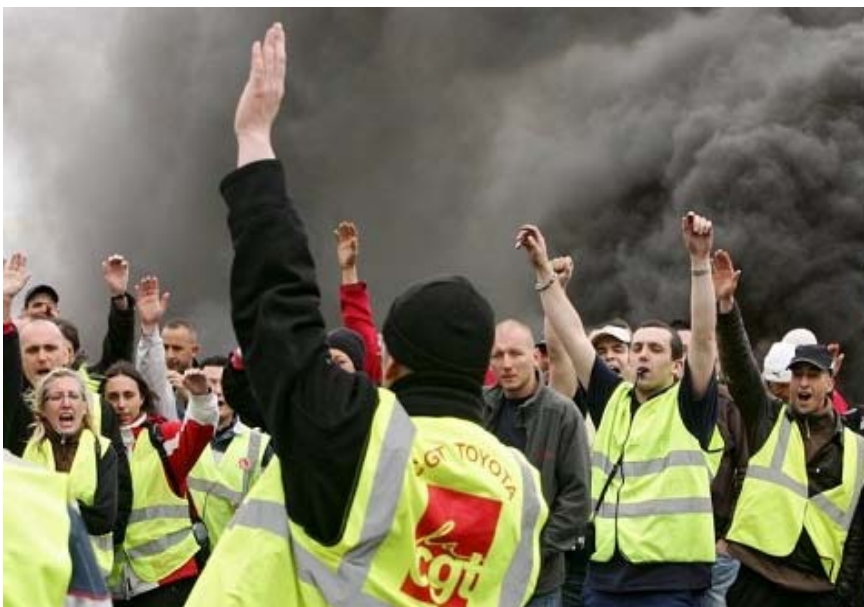
Streikende Toyota-Mitarbeiter in Onnaing in Nordfrankreich

Circa 200 Kollegen von den Werken in Grenoble und Echirolles ziehen wütend zur Generalversammlung der Gewerkschaften, die das Ende des Konfliktes im fernen Paris unterzeichnet haben. Die Gewerkschaftsdelegierten, die in Paris nach 9 Stunden Verhandlung mit der Unternehmensführung antreffen, werden von den Arbeitern nicht in den Saal hin-