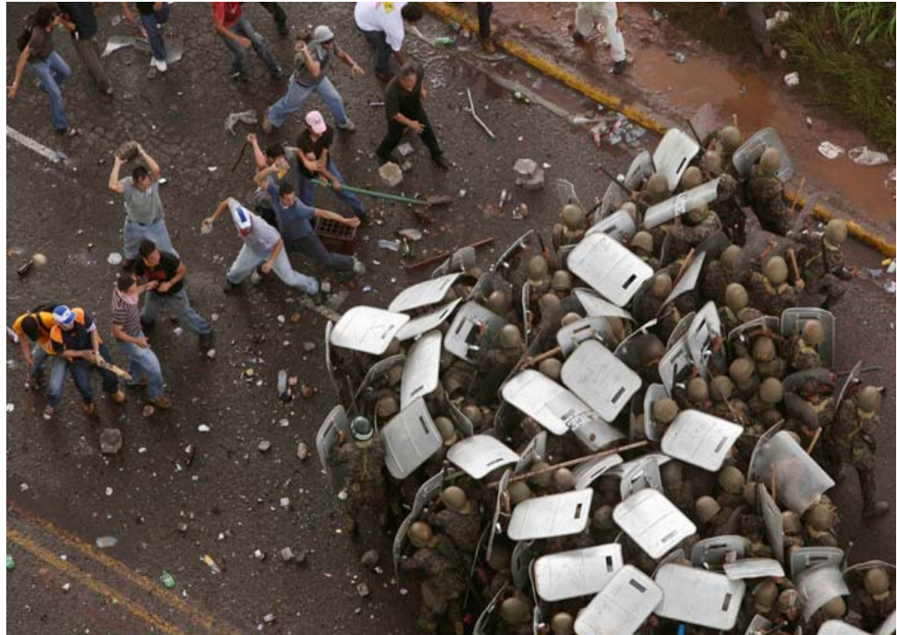
Proteste in Tegucigalpa

Wahlboykott im November. Noch könnte seine Rückkehr das Aufrechterhalten des reaktionären Regimes und der von den Putschisten genutzten Institutionen unter der Verfassung von 1982 erlauben, denen Zelaya selbst angehört. Deshalb glauben wir heute mehr denn je, dass die Lösung darin liegt, die strategische Schwäche des Regimes zu nutzen, um eine unabhängige proletarische Lösung zu finden, die sich auf die Erfahrungen der Arbeiter, Bauern, Armen und Frauenbewegung stützt, die den Widerstandskampf der letzten Monate anführten. Diese Erfahrungen zeigen, dass weder die geheime Diplomatie noch Verhandlungen von oben den Arbeitern zu einem Sieg gegen die Putschisten verhelfen können.