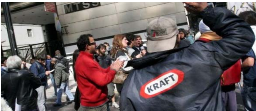
Arbeitersolidarität vor dem Gericht

Leblosigkeit geprägte Agenda nach fünf Wochen Stille und Lähmung ändern, um den Delegierten von Terrabusi eine Tribüne bei ihrer Veranstaltung „für die gewerkschaftliche Freiheit“ einzuräumen.