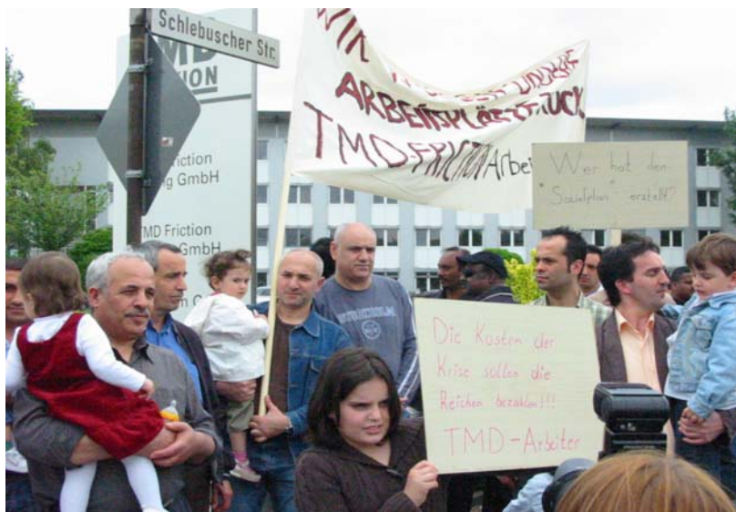
Die Mitarbeiter des Autozulieferers TMD Friction und ihre Kinder wissen es besser