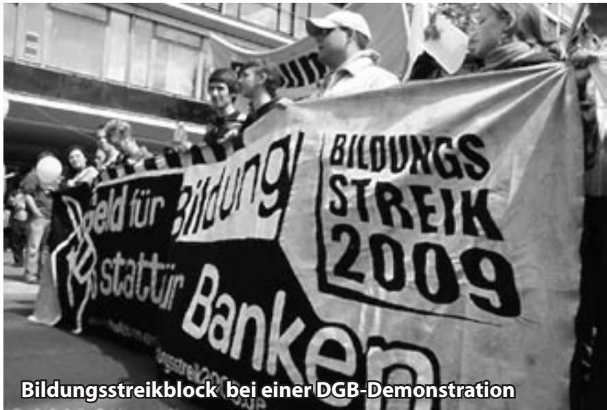
Bildungsstreikblock bei einer DGB-Demonstration

sammlung in der Mensa kam hauptsächlich aufgrund eines glücklichen Zufalls zustande, und weitergehende Arbeit mit den Beschäftigten fand (außerhalb der AG Arbeitskämpfe) nicht statt.