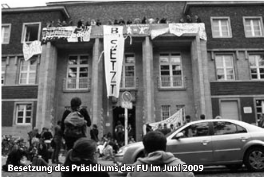
Besetzung des Präsidiums der FU im Juni 2009

wie längeren Öffnungszeiten für einzelne Bibliotheken bis zur Abschaffung des Bachelor/Master-Systems reichten. Bezeichnenderweise wurde allerdings nicht die Abschaffung des Numerus Clausus gefordert, der eine der größten Hürden gegen breiteren Zugang zu höherer Bildung darstellt. Forderungen, die über die Universität hinaus gingen, gab es kaum – geschweige denn solche, die über das Bildungssystem als Ganzes hinaus gingen.