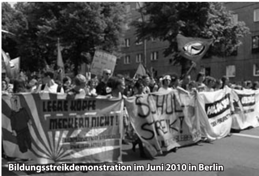
Bildungstreikdemonstration im Juni 2010 in Berlin